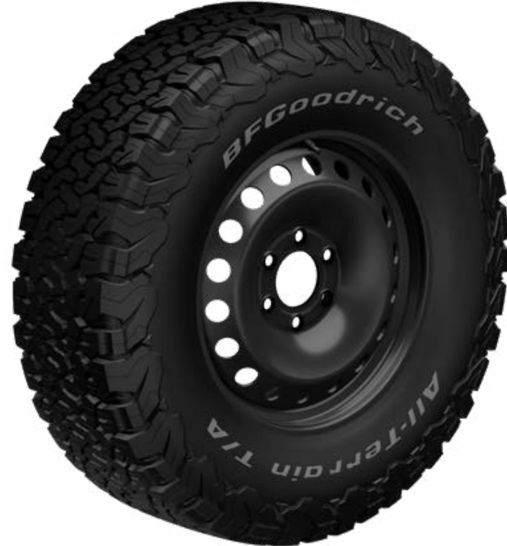
BFGOODRICH ALL-TERRAIN T/A K02 TYRE